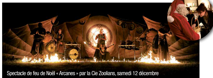
Spectacle de feu de Noël « Arcanes » par la Cie Zoolians, samedi 12 décembre

Si l'évolution de la situation sanitaire le permet, le traditionnel Village de Noël réchauffera et illuminera le cœur thermal. Vendredi 18 décembre en nocturne, samedi 19 et dimanche 20 décembre, la féerie de Noël envahira le Parc thermal ! Spectacles, chalets en bois, illuminations, village gourmand seront au rendez-vous.