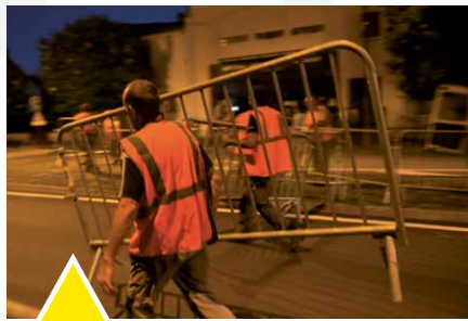
Barrières, sécurité, accueil, animation : plus de 60 agents municipaux ont été mobilisés !