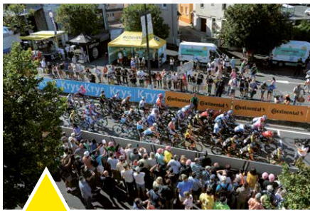
Plusieurs milliers de personnes ont assisté au départ de la Caravane et du peloton, avenue de l'Europe.