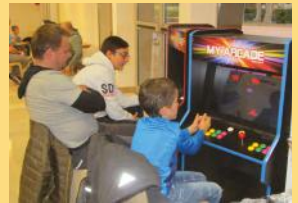
LE WEEK-END DU JEU