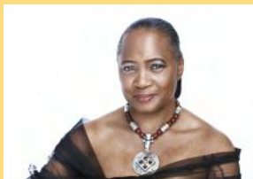
BARBARA HENDRICKS ET SON BLUES BAND

Depuis plusieurs années, elle plonge dans les racines du jazz, le blues. De l'opéra au jazz en passant par le gospel, la voix de la grande Barbara Hendricks fait résonner la musique dans le monde entier depuis plus de 40 ans. Ce programme original, au swing irrésistible, foisonne de trouvailles, charme et surprend par son originalité.