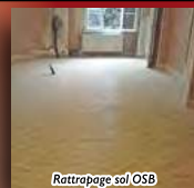
Ratrapage sol OSB